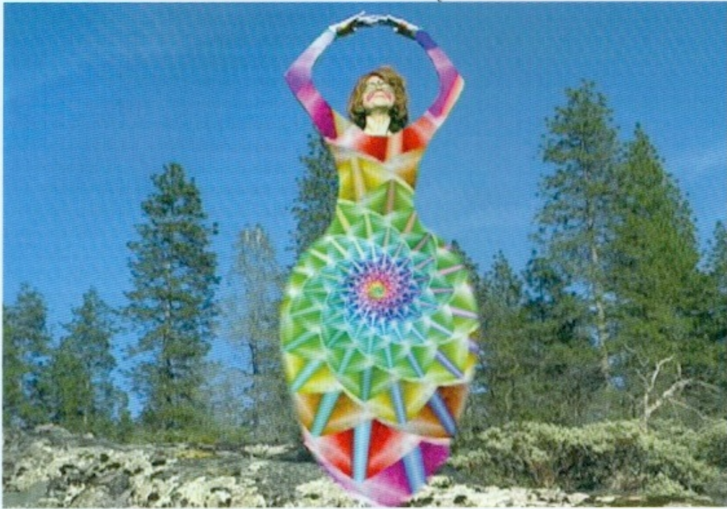
Shana Moulton Whispering Pines 4 , 2013 Vidéo, 10'53" Court. galerie Crèvecoeur