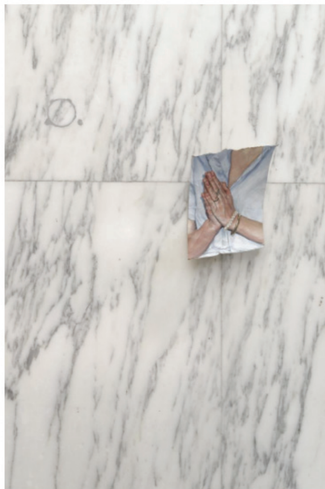
Louise Sartor, Pray (2016), gouache sur rouleau de papier toilette, 15 x 9,5 cm.

Louise Sartor (galerie Crèveœur à Paris)