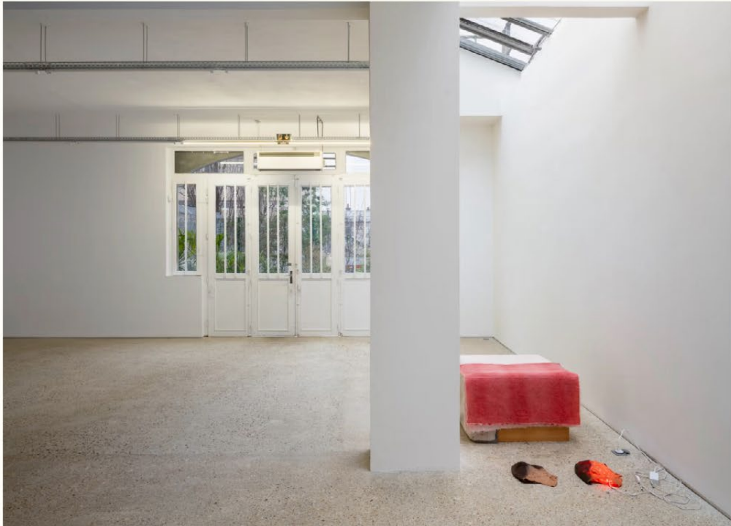
Vue de l'exposition « Michael E. Smith », Crèveœur, Paris, 2025.